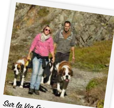
Sur la Via Francigena