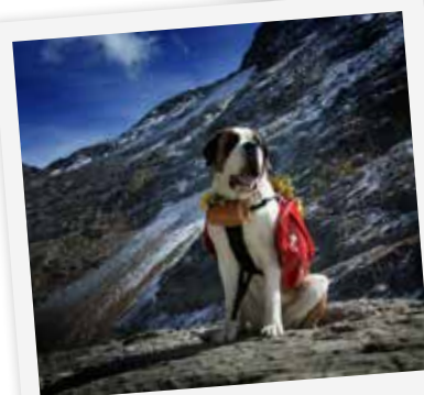
Les Saint-Bernards de l'Hospice