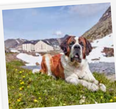
L'Hospice du Col