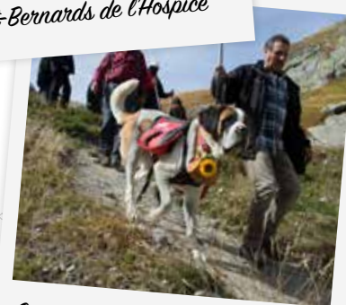
Sur le chemin vers Aoste